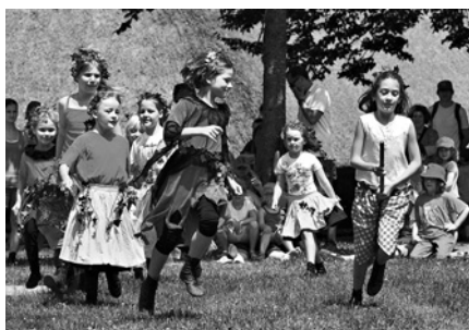
Beim Kürnbacher Kinderfest am 25. Mai ist das Museumsdorf fest in Kinderhand.