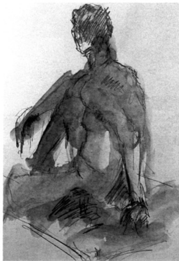
Sabine Blasizzo: Akt in Bleistift und Tusche

ALTES KLOSTER BAD SCHUSSENRIED KLOSTERHOF 13 / 1