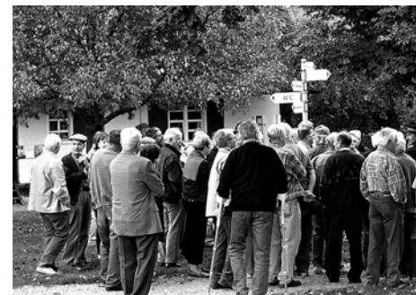
In einer kostenlosen Sonderführung erfahren die Besucher des Museumsdorfs Kürnbach am 21. April Spannendes über das Dorfleben anno dazumal.