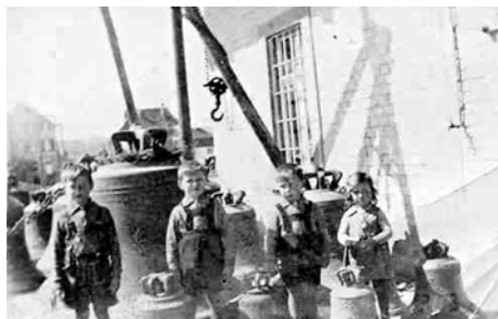
Die abgehängten Glocken stehen zum Abtransport beim Schussenrieder Bahnhof bereit