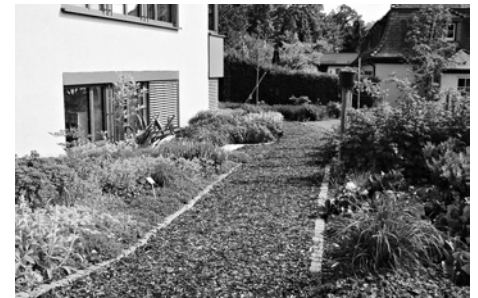
Erkunden Sie am Tag der offenen Tür den neuen Kreislehrgarten beim Landwirtschaftsamt

Am Landwirtschaftsamt wird an diesem Tag keinerlei Parkmöglichkeit bestehen. Die Anliegerstraßen „Osterbergstraße“ und „Beim Fohrhäldele“ sind von 13 bis 17 Uhr komplett gesperrt und nur für Anlieger frei. Die Besucher werden gebeten, ihre Fahrzeuge kostenfrei beim ehemaligen Freibadparkplatz abzustellen. Von dort aus besteht die Möglichkeit mit dem ebenfalls kostenfreien Shuttleservice im Minutentakt zum Landwirtschaftsamt zu gelangen oder dem ausgeschilderten Fußweg von zirka 500 Metern zum Landwirtschaftsamt zu folgen. Weitere Informationen unter www.biberach.de .