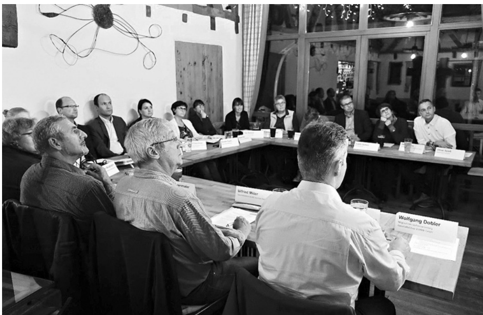
Sitzung des LEADER-Steuerungskreises der Regionalentwicklung Mittleres Oberschwaben.