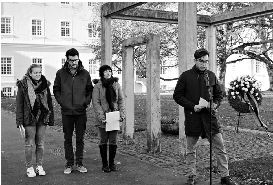
Die Schülerinnen und Schüler der Gesundheits- und Krankenpflegeschule trugen einen berührenden Beitrag vor.