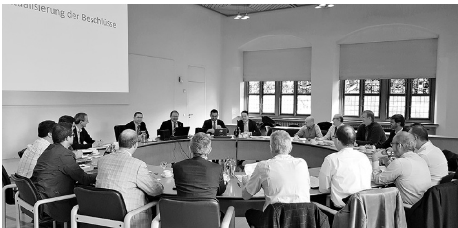
40. Sitzung der Vereinigung der Prüfstellen für angriffshemmende Materialien und Konstruktionen (VPAM) im Ulmer Rathaus.