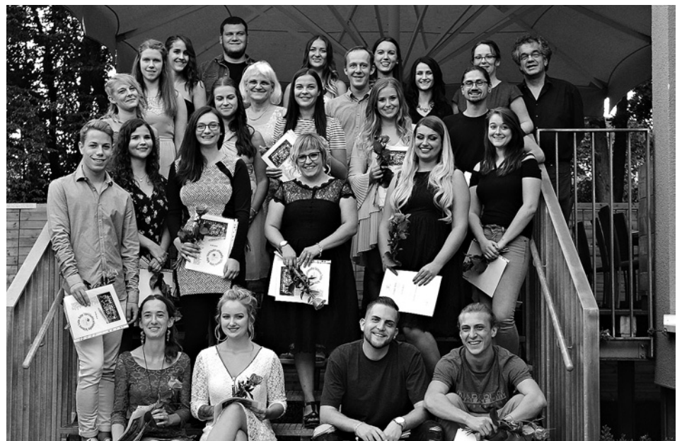
Geschafft – 23 Absolventinnen und Absolventen können ihre Berufslaufbahn in der Gesundheits- und Krankenpflege starten.