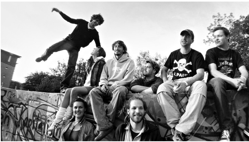
Manarun heizt am 13. Oktober im Kulturzelt ein.