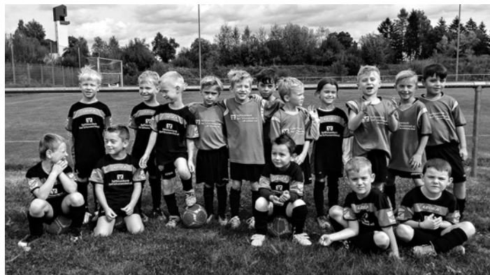
Bambinis in Bad Schussenried