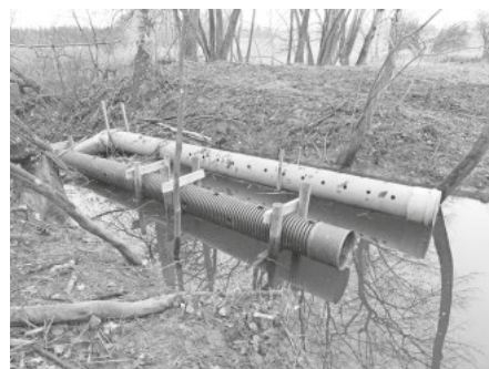
Ein zweites Regulierungsrohr ist eingebaut (Dez.2025)

Auf Veranlassung der Unt. Naturschutzbehörde baut dann der Städt. Bauhof Anfang Dez. 2025 im ehemaligen Damm des Unteren Schussenweihers ein zweites Regulierungsrohr ein. Der Wasserstand sinkt aber nur kurzzeitig. Jetzt Anfang Februar 2026 ist der Wasserstand fast unverändert hoch und die Fraßschäden um den Quellbereich haben erheblich zugenommen.