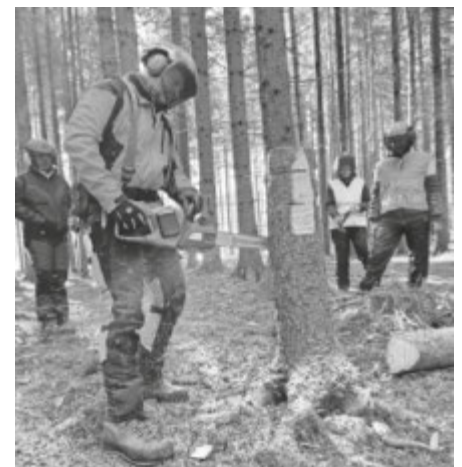
Im Grundlehrgang zum sicheren Umgang mit der Motorsäge lernen die Teilnehmerinnen und Teilnehmer unter anderem Fäll- und Schneidetechniken unter einfachen Bedingungen.

Die Teilnehmerinnen und Teilnehmer werden gebeten, eine komplette persönliche Schutzausrüstung bestehend aus Schnittschutzhose, Schnittschutzstiefeln, Arbeitshandschuhen, Helm mit Gehörschutz und Gesichtsschutz sowie einen Nachweis über eine private Unfallversicherung oder die Mitgliedschaft in der Landwirtschaftlichen Berufsgenossenschaft (SVLFG) mitzubringen. Interessierte können sich auf der Homepage des Landratsamts Biberach unter www.biberach.de/kreisforstamt unter der Rubrik Veranstaltungen anmelden oder über nebenstehenden QR-Code. Weitere Informationen sowie einen Lageplan der jeweiligen Treffpunkte erhalten sie einige Tage vor dem Lehrgang per E-Mail.