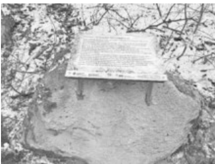
Gedenktafel zum Treffen der Bauern 1525

Rudolf Rutka, Führer des Bauernhaufens Muttensweiler, sprach den Dank für die Errichtung dieses Denkmals aus; die Tafel sei ein guter Auftakt für die Landesausstellung „Uffrur“. Zum Abschluss erscholl der Schlachtruf des Muttensweiler Bauernhaufens.