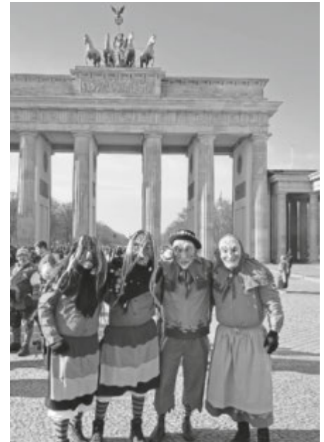
Die Narrenvereine Reichenbach und Olzreute waren dabei

veranstaltung in der Landesvertretung Baden-Württemberg in Berlin ausgerichtet. Mit einem mitreißenden Programm und knapp 160 Närrinnen und Narren aus den 56 Mitgliedszünften brachte der VAN die schwäbisch-alemannische Fasnet in die Hauptstadt und begeisterte die Gäste mit gelebtem Brauchtum, ihren bunten Häusern und ihren traditionellen Holzmasken.