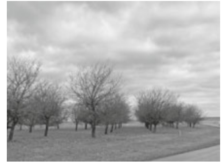
Die Obst- und Gartenbauakademie Biberach (OGAB) bietet am Donnerstag, 13. und Samstag, 15. Februar Seminartage zum Obstbaumschnitt auf der Laupheimer Airbase an.

Anmeldeschluss ist Freitag, 7. Februar 2025.