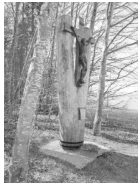
Das erneuerte Kreuz am Buckenberg

sen. Bei schlechtem Wetter wird der Hock in das Vereinsheim am Zellersee verlegt.