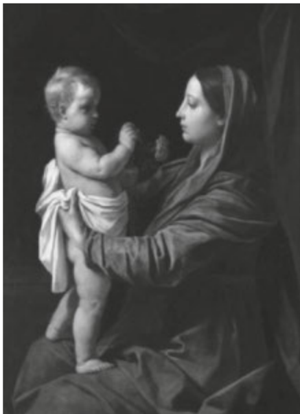
Bilddaten: Simone Cantarini, genannt il Pesarese, Madonna della Rosa , Öl auf Leinwand, 127,8x96,3 cm, Privatbesitz.

In dramatischem Hell-Dunkel schildert der italienische Maler Simone Cantarini (1612-1648) dem Betrachter eine intime Szenerie zwischen Maria und dem Jesuskind. Ungewohnt frühreif erscheint das Knäblein, wenn es sich auf dem Schoß seiner eleganten Mutter aufrecht erhebt und ihr das Kreuz eines Rosenkranzes zur näheren Betrachtung vorlegt. Mit diesem verbunden hält es eine Rose in der Hand, deren geöffnete Blüte sich zur Mutter hinneigt. Im Blick Mariens scheint sich die Vorahnung über das künftige Geschick des Sohnes abzuzeichnen, das die Freude ihres gegenwärtigen Beisammenseins gleichsam durchkreuzt. Das umgekehrte kompositorische Dreieck, das zwischen Mutter und Kind sich aufstellt, ihre Gesichter an seiner Basis verbindet und Kreuz und Rose in unseren Gesichtspunkt rückt, lädt ein, an diesem inneren Gespräch teilzunehmen.