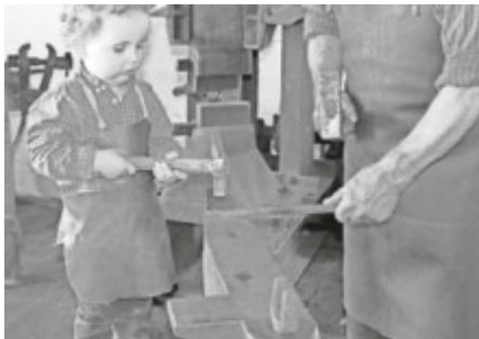
Lebendiges Handwerk für Kinder: Kinderwerkstatt „Hammer und Amboss“ von 10 Uhr bis 16 Uhr im Oberschwäbischen Museumsdorf Kürnbach.