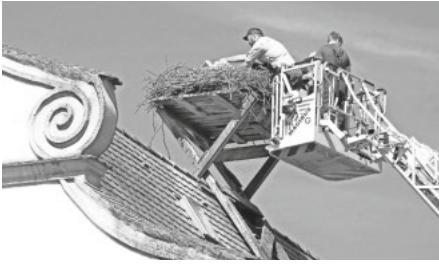
Brigitte Frosdorfer: Mit der Drehleiter hoch oben am Nest

Er befindet sich zur Zeit in Pflege in Bad Buchau. Zum Vergleich: In Reichenbach brüteten 2018 zwei unberingte Weißstörche und am Ende der Brutzeit standen vier Jungstörche im Nest.